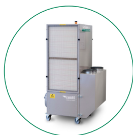
SILENZIATORE (SOLO PER MODELLO VERTICALE), 1-2 PZ PER UNITÀ