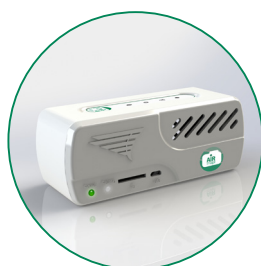
SENSORE AIR IMAGE