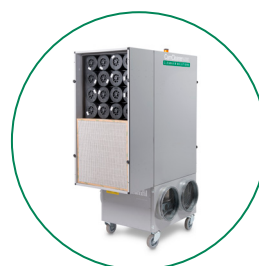
BOX MOLECOLARE 2X32 PZ CAMCARB CG 1300 INCLUSI 2 TELAI (SENZA FILTRO), 2 PZ PER UNITÀ